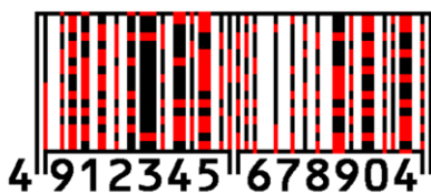
画像は特殊黒を赤で表示

二重符号化シンボルは、バーコードや二次元コードの黒色部分を、普通黒と特殊黒の二種類の黒色を用いて符号化したものです。通常のリーダーやスキャナーでは通常のコードとして認識されますが、特殊黒を識別可能なリーダーでは二重符号化シンボルとして認識されます。