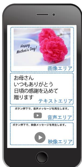
しゃべるメッセージ カード表示例